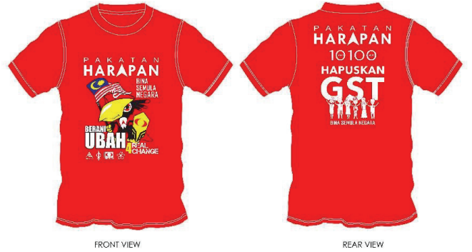
Pakatan Harapan kampanya T-shirt örneği