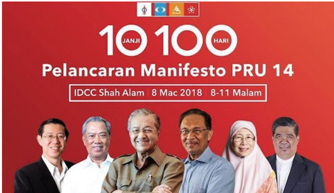
Mahathir ve ekibi, 100 günde 10 hedef başlığı altında