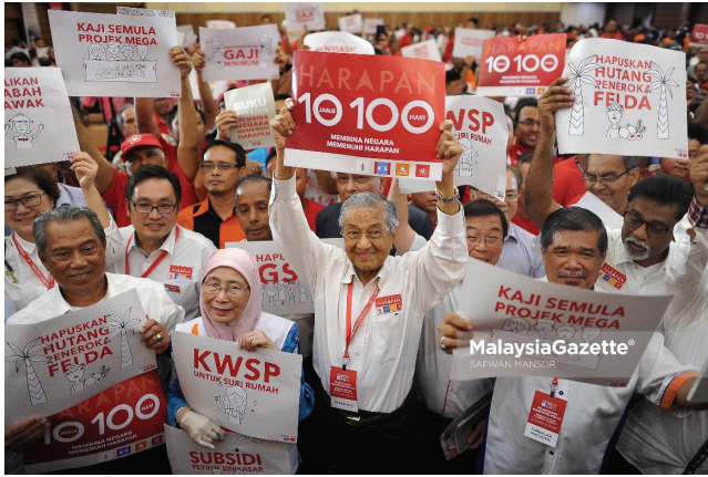
Mahathir ve ekibi 100 günde 10 hedef afişleriyle fotoğraf veriyor.

Sağ ve sol uçları içinde barındıran bir ittifakta seçim sonrası itilaf çıkması veya bazı grupların yeni yönetimi domine edip diğerlerini geri planda bırakması ihtimalini Mahathir kişisel karizması ve güvenilirliğiyle zayıflattı. 2013 seçimlerinde muhalefet ittifakının seçim kazanamamasında muhafazakar Malay'ların ittifaktaki sol partilerden ötürü muhalefete oy vermekte tereddüt etmesi rol oynamıştı. O zamanki başbakan adayı Anwar İbrahim bu engeli aşamamış, Malay'lardan aldığı destek sınırlı kalmıştı. 2018 seçimlerinde ise Mahathir Malay oylarını ittifaka katarak seçim zaferine önemli bir katkı yaptı.